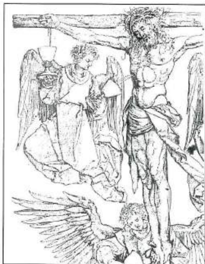
La Crucifixión, Alberto Durero

propiedad simplemente natural del hombre, como la describían los mejores filósofos de la antigua Grecia; es su vocación por parte de Dios, lo que Dios eternamente ha querido para cada uno de nosotros. La implicación inmediata es que para todos nosotros hay sólo dos posibilidades: o bien la adopción divina en Cristo, el acceso final, ya anticipado en la vida presente, a la vida divina hecha nuestra; o si no, la vida en la muerte y antes la muerte en vida.