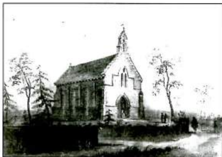
Exterior de la iglesia de Littlemore, 1840

"Newman nunca nos permitió tratarlo como a un superior sino que se colocaba al nivel del más joven. Recuerdo que insistía en que no lo llamásemos Mr. Newman, tal como se estila tratar en Oxford a los fellows y tutors de los colegios. Quería que le dijésemos simplemente «Newman...»" (id., p.39).