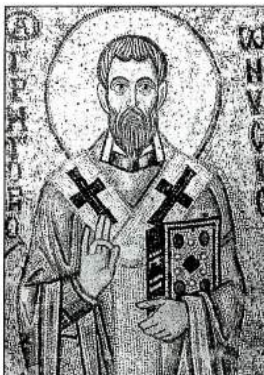
San Gregorio de Nisa

sino lo somos, y lo que seremos no ha sido manifestado aún, pero sabemos que cuando Dios se manifieste seremos como Él es, porque lo veremos como es»