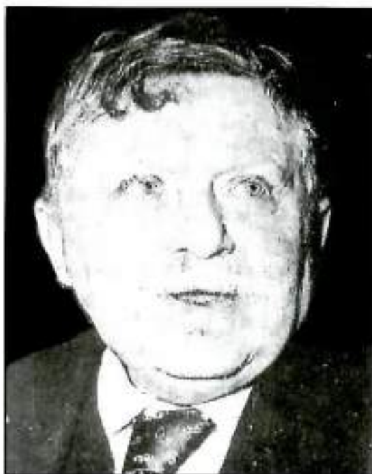
El filósofo Gabriel Marcel

Sin embargo, tal vida de la fe puede y tiene que ser manifestada ya ahora: en la vida de la caridad, que significa —como lo expresa San Pablo en el capítulo 5 de su carta a los Romanos— «el propio amor de Dios derramado en nuestro corazón por el Espíritu que nos ha dado». Una vez más el misterio,