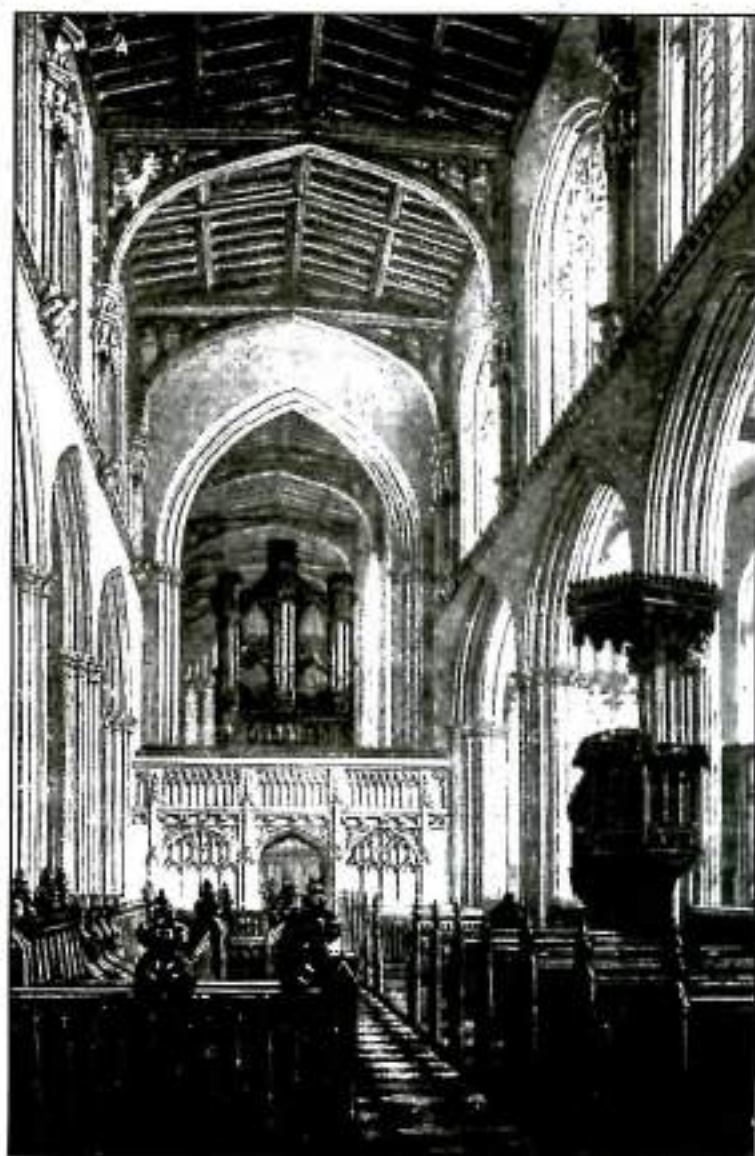
Interior de St. Mary The Virgin

Será también la mejor oportunidad para retornar a la gran importancia de la poesía en relación con la religión cristiana, así como con la verdadera cultura intelectual. Ya hemos dicho y subrayado su importancia en la obra de Newman: tanto su personal interés por la poesía como su poder poético, o capacidad de hacernos realizar (con el potente sentido del inglés «to realize») las cosas religiosas. Empero, Newman ha sido muchas veces malinterpretado por algunos benedictinos (como, por ejemplo, Dom Cuthbert Butler en su comentario de la regla benedictina) cuando dice, en el primero de dichos ensayos, que la vida del monje benedictino aparece como especialmente «poética». No ha visto