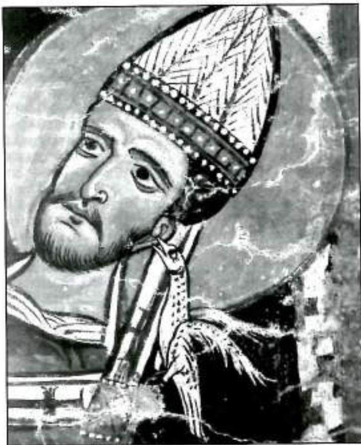
San Gregorio Magno

que tienen de político: la obra que tuvieron que hacer era tal que nadie más que un monje, con su sobrehumana sencillez de alma y su pertinacia de propósito, estaba en condiciones de realizarla. Lo mismo en el caso de San Bonifacio, el apóstol de Germania, y en el de otros misioneros de su época, parece haber habido una particular inspiración que los arrastró al extranjero; y se observa, después de todo, cuán pronto muchos de ellos se asentaron en su nueva patria, llevando una vida mixta de agricultores y pastores, retomaron la vida sosegada a la cual originalmente se habían consagrado. En cuanto a los Padres Griegos de la primera edad, a algunos de los cuales ya nos he-