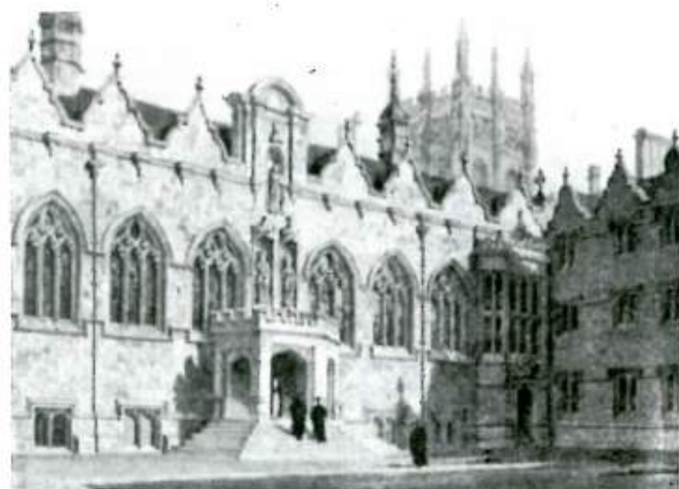
El frente del Oriel College, por LF. Mackenzie.

Ordenado diácono en 1824, se hizo cargo del servicio en la iglesia de San Clemente, pero lo dejó en 1825, al ser ordenado sacerdote, porque aceptó ser tutor en Oriel. De inmediato se dedicó a guiar a los estudiantes, comenzando a colaborar efectivamente en la realización de un elevado concepto de la Universidad. En 1827 su saber y personalidad llegaron a ser tan estimadas que se lo nombró examinador para el grado de bachelor of Arts. En 1828 fue designado vicario de Saint Mary the Virgin , la parroquia universitaria tan allegada a Oriel y pudo completar la formación de sus estudiantes con sus Sermones Universitarios . Entrando a esta iglesia, resulta conmovedor ver el altar en que ofició y el púlpito desde donde predicó, y no sólo a los estudiantes, sino también a los simples parroquianos (comerciantes en su mayoría) en sus Parochial and Plain Sermons .