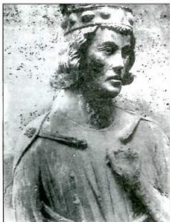
San Luis, rey de Francia

En el siglo XV, en cambio, el creciente nacionalismo, la separación de los idiomas y el aumento de poder de los nobles —mayor que el del rey— influyeron en la Universidad, que tomó un carácter más localista y aristocrático . Se advierte el cambio en los colegios: las familias nobles enviaban a sus hijos con sirvientes, por lo cual se transformaron los edificios que fueron más ricos y representaron a grupos locales. La universidad se volvió un ámbito de política y poder.