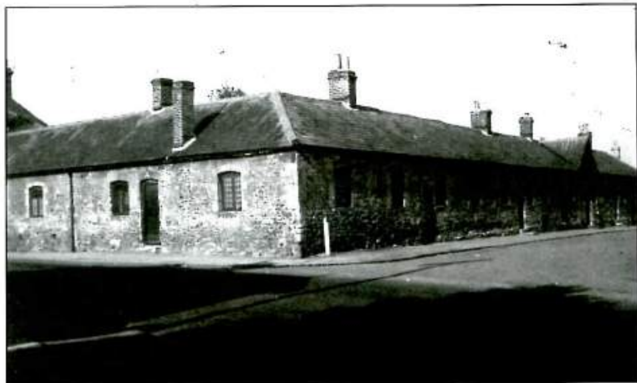
El colegio de Littlemore

uno, llegó a realizar la idea de un "College" a partir del momento en que, a raíz de las críticas que levantó en Oxford su Tracto 90, decidió dejar sus habitaciones en el Oriel y, con su enorme biblioteca, trasladarse del todo a Littlemore.