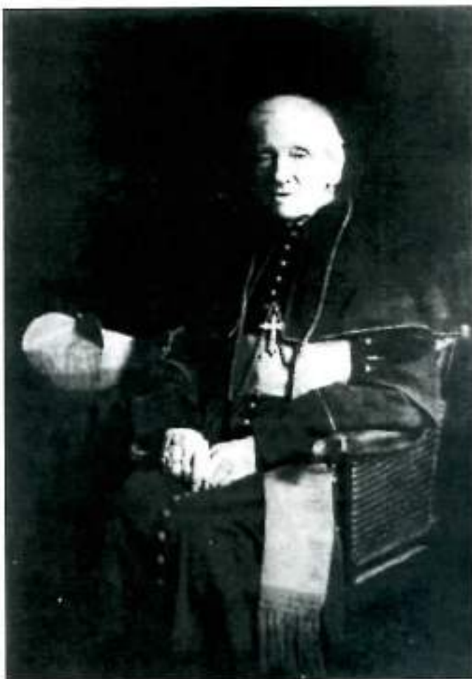
John Henry Newman

Del mismo modo, las personas que no han estudiado el tema de la ética o de la política, o temas eclesiásticos, o de teología, no conocen el valor relativo de las preguntas que enfrentan sobre estas áreas del conocimiento. No comprenden la diferencia entre un punto y otro. Uno y otro son lo mismo para ellos. Los miran como los niños contemplan los objetos que sus ojos encuentran, de un modo vago e inaprensivo, como si no supieran si algo está lejos o al alcance de su mano, si es grande o pequeño, duro o blando. No tienen ningún medio para juzgar, ninguna pauta para medir y emiten un juicio al azar, diciendo sí o no a preguntas muy profundas, según se le ocurra a su imaginación en ese momento, o según algún argumento inteligente o