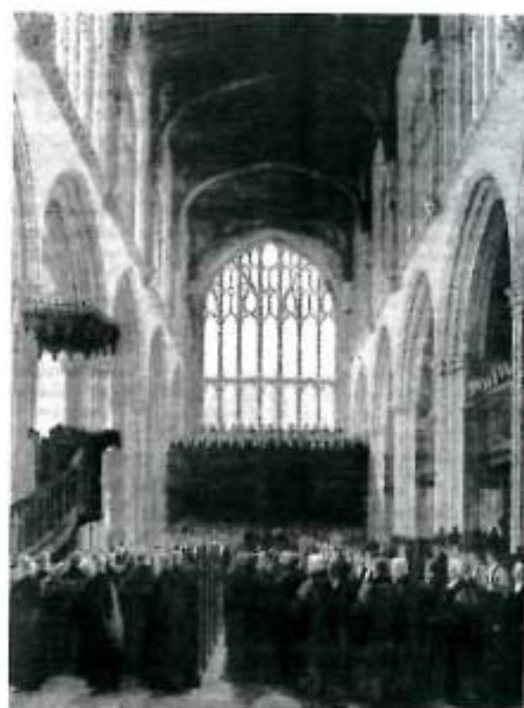
Interior de Santa María de Oxford antes de un sermón (dibujo de 1835).

Pero una cosa es cierta: las universidades e instituciones escolares a las que me he referido, que han hecho poco más que reunir primero niños y luego adolescentes en gran número, con todos sus lamentables defectos en el terreno moral, con un Cristianismo vacío, y un código ético pagano, pueden enorgullecerse al menos de una su-