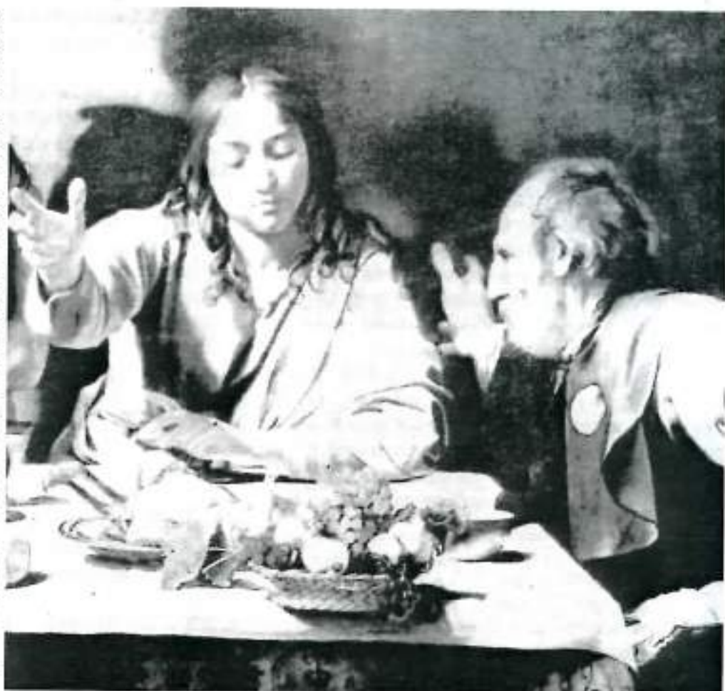
La comida de Emaús, de Caravaggio, National Gallery, Londres.

1. ¡Oh mi Dios, Tú y sólo Tú eres toda sabiduría y todo conocimiento! Tú sabes, Tú tienes determinada cada cosa que nos suce-