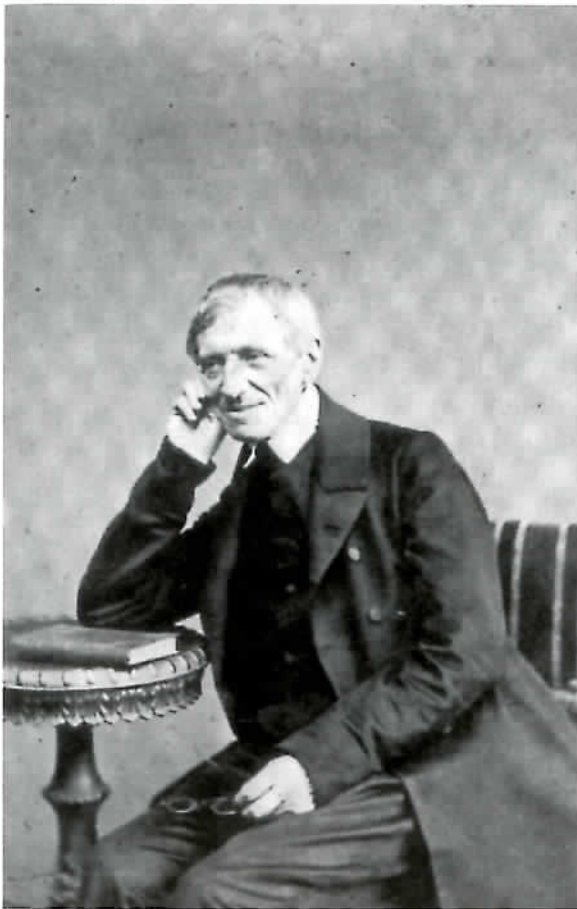
John Henry Newman ( foto - 1864 )

3. Dios mío, Te recibo a Tí como mi parte y herencia. Por mera prudencia me convierto del mundo a Tí, dejo el mundo por Tí. Renuncio a aquello que promete por Aquel que cumple. ¿A quién más iré? Deseo encontrarte y alimentarme de Tí aquí. Deseo alimentarme de Tí, Jesús, mi Señor, que has resucitado, que has ascendido a lo alto, que todavía permaneces con Tu pueblo en la tierra. Levanto mis ojos hacia Tí, y busco el Pan Viviente que está en el cielo, y que desciende del cielo. Dame siempre de este Pan. Destruye esta vida, que pronto perecerá, aun cuando no la destruyas, y lléname con esa vida sobrenatural que nunca morirá.