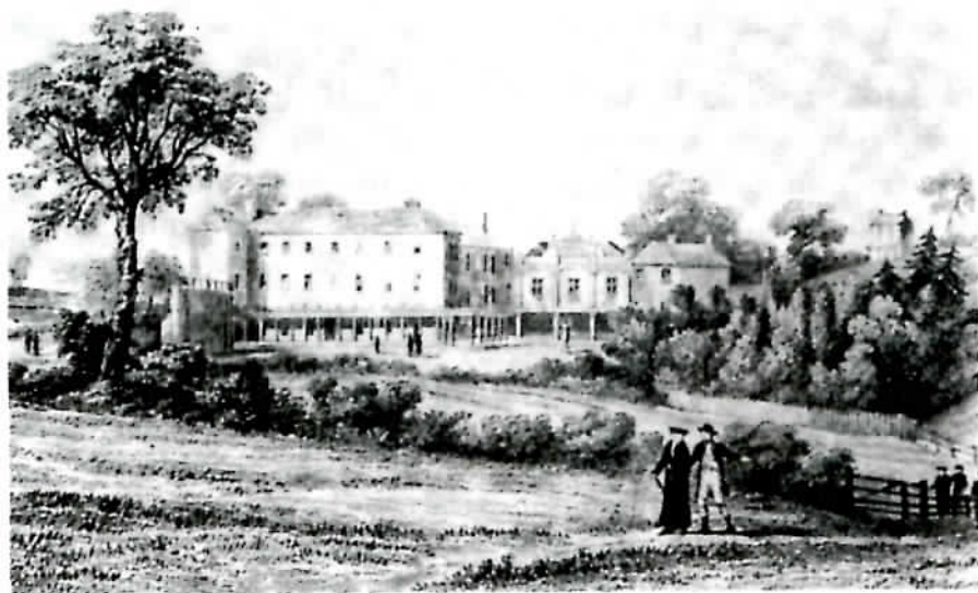
St. Mary's College, Oscott. Grabado en Maryvale.

Si bien la conversión se puede entender como un desarrollo, esto no significa que la conclusión no suponga siempre un 'paso' final firme y definitivo, que necesita de voluntad y es siempre libre. Antes de aventurarse tampoco se ve claro. Por otra parte el converso sufre incomprendimientos de ambas partes. Estas dificultades propias del camino hacia la verdad, hacen que la conversión sea generalmente lenta, y por lo tanto no se pueda hacer todo de una vez. ¿Qué obra buena llegaríais a comenzar si desearais, ya desde el principio, ver la terminación? Si queréis hacer todo de una vez, no haréis nada. El que comienza bien ha realizado la mitad del trabajo... Es mejor venir con rapidez, pero es aún