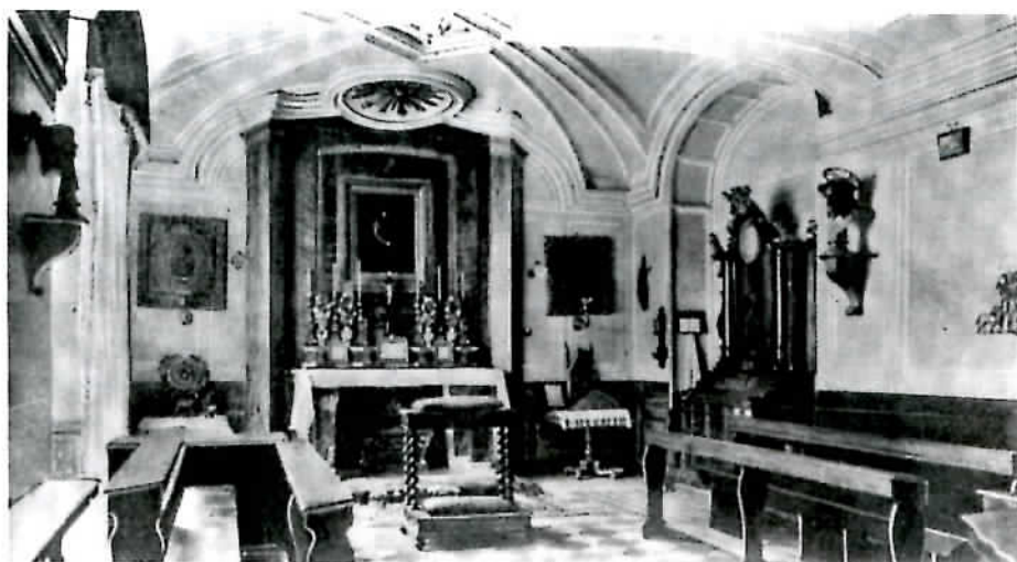
Capilla del Colegio de Propaganda Fide en Roma, donde Newman celebró su primera misa en 1846.

una brisa suave?... Después de Savonarola, Felipe. Y la vida de un santo tiene su propio fuego. Nada era demasiado alto o demasiado bajo para él. Les enseñó a pobres mujeres mendigas a hacer oración mental, llevaba los chicos a jugar, protegió huérfanos y actuó como maestro de novicios con los hijos de Santo Domingo. Fue maestro y director de artesanos, mecánicos, cajeros de banco, mercaderes, orfebres del oro, artistas y hombres de ciencia. Fue consultado por monjes, canónigos, abogados, médicos, cortesanos, damas de la más grande alcurnia, convictos yendo a la ejecución, que a su turno atrajeron su solicitud y oraciones. Cardenales rondaban por su habitación, y Papas pidieron su milagrosa ayuda en la enfermedad y su asistencia a la hora de la muerte. Fue su misión salvar a los hombres, no del mundo sino en él. Para romper con la altanería del rango y el fastidio de la moda, dio a sus penitentes mortificaciones públicas. Para sacar a la juventud de los teatros, abrió su Oratorio de Música Sacra. Para rescatar a los descuidados del Carnaval y sus excesos, implantó la peregrinación a las Siete Basílicas. Para aquellos que amaban la lectura, sustituyó las obras de caballería o las novelas perjudiciales por el verdadero romance y la poesía celestial de las Vidas de los Santos. Puso a uno de sus discípulos a escribir historia sobre las herejías de la época, a