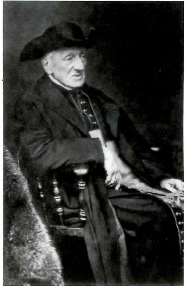
John Henry Newman Cardenal: a los 85 años ( foto - 1886 )